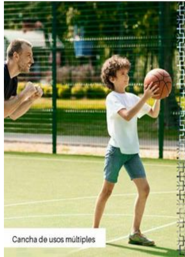
Cancha de usos múltiples