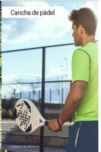
Cancha de pádel