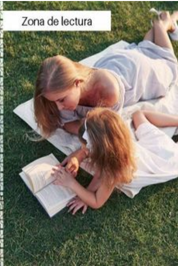
Zona de lectura